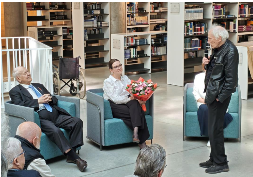
Учителя поздравляет академик Андрейс Цеберс - из первого выпуска кафедры (1971 г.), по моему личному мнению - самый сильный физик-теоретик Латвии

https://www.facebook.com/boriss.cilevics/posts/pfbid02rgJ4SpL1QPA4UJ4rQXysjMuLsQtXTYo9Nm6EVeDVTTOwqhrATryoE1h87APm9Dd4l