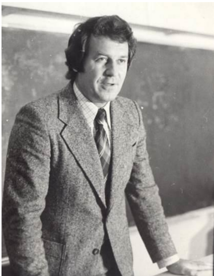
Юрис Микельсонс в середине 70-х