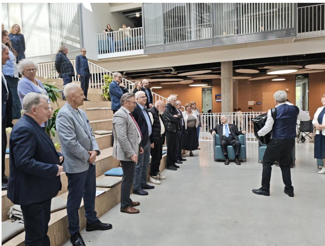
Традиционная "Sveiks lai dzīvo!" в исполнении коллег и бывших студентов юбиляра