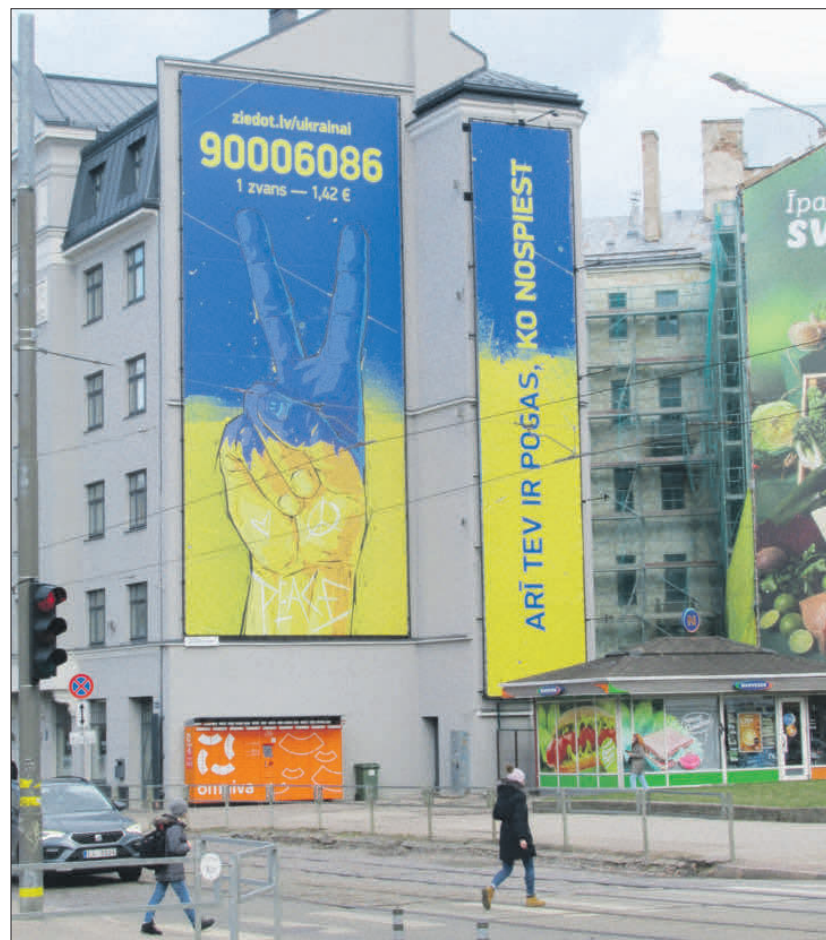
Na ulici v Rigi, prestolnici Latvije

Tretje vprašanje zadeva predsedniške in parlamentarne volitve, ki bodo junija prihodnje leto. V Turčiji obstaja resnično politično okolje, pravi politični boj, prave volitve, tako da Turčije ne moremo primerjati z avtokracijami, kakršni sta Belorusija ali Rusija. Kljub temu obstaja kar nekaj zelo resnih problemov. Mnogo