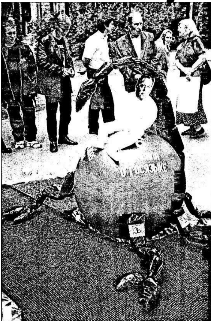
PROTESTI. Šobrīd vēl nav skaidrs, vai «Par cilvēka tiesībām vienot Latvijā» rīkots jaunas akcijas, kas saistītas ar valdības pieņemtajiem valodas noteikumiem. Šādus noteikumus tiks krīti izanalizēti.

Noteikumos par sabiedrisko organizāciju un privāto uzņēmējdarbību nosaukumiem arī šobrīd nav skaidrs, kā pēc visiem nosaukumiem jābūt tikai vienai valsts valodai. Te ir grūti saredzēt likuma sabiedriskās intereses. Kā pēc, piemēram, Po-