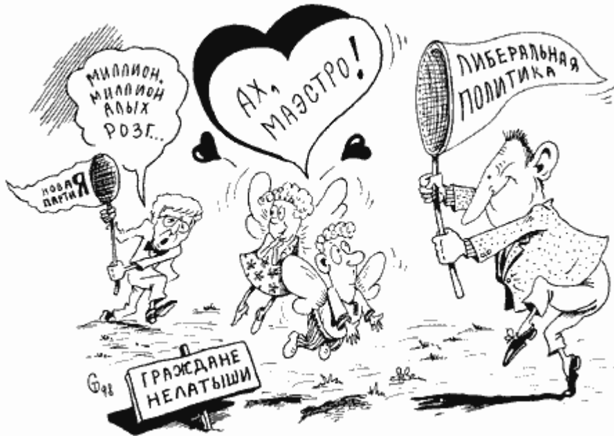
Рисунок Сергея ТЮЛЕНЕВА

Вряд ли из «идеологических соображений», на которые указывают национал-радикальные политологи: мол, русские по своей ментальности не приемлют рыночной экономики и европейской демократии. Социология и элементарная логика говорят как раз об обратном.