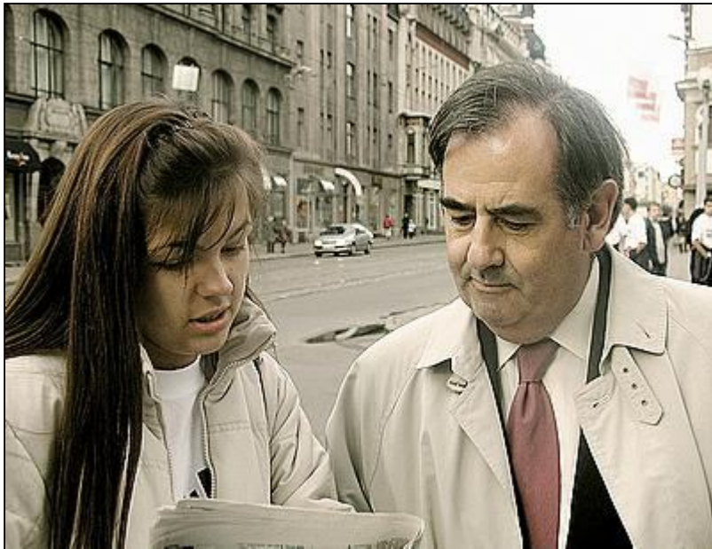
Хиль-Роблеса в Риге интересовали проблемы русских школ.

Будет ли новый комиссар так же объективно оценивать происходящее в нашей стране, как Альваро Хиль-Роблес? Об этом в беседе с «Часом» рассуждает депутат Сейма от ПНС, член латвийской делегации Парламентской ассамблеи Совета Европы и подкомитета ПАСЕ по правам человека Борис Цилевич.